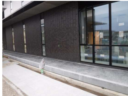
信楽焼きタイルを外装に使用