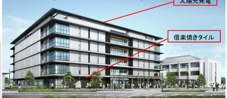
外観イメージ(2015年6月公表の実施施工資料)

移転完了後、旧庁舎は改修工事に入ります。行政情報コーナー・喫茶コーナー・ランチルームなどに新しく生まれ変わります。こちらの改修工事は平成30年1月末に完成予定です。