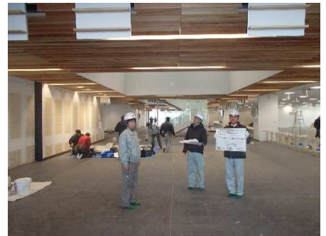
県内木材を天井に使用