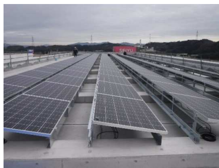
屋上太陽光パネル施工状況