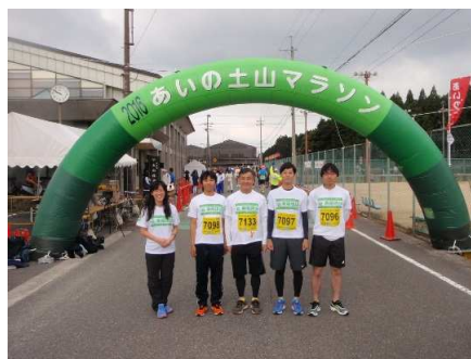
全員無事完走しました。