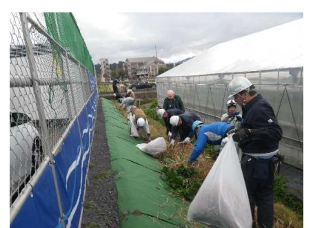
掃除で体も温まります。