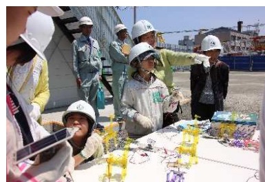
太陽光発電を体験