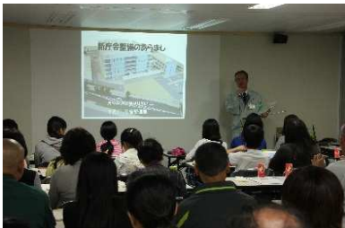
工事の進捗状況の説明

現場見学会が甲賀市役所の企画で開催されました。まず、工事の進捗状況や免震装置の説明を受けいよいよ現場の見学です。免震構造とは地盤と建物の間に地震を受け流す免震装置を設置し、地震力を低減するものです。現場内で使用される3種類の免震装置も見学しました。