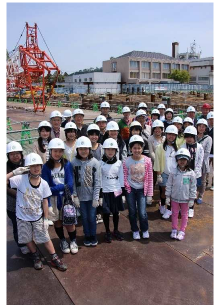
午前の見学会のみなさま