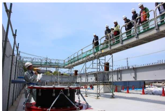
免震装置を見学通路から見学