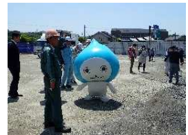
マスコットキャラクターとのふれあい