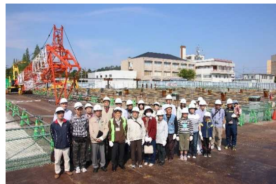
午後の見学会のみなさま