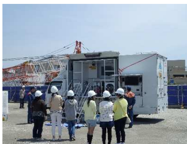
水口消防署の起震車体験